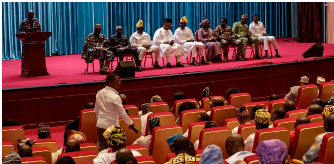
Vue partielle des participants à la première session du nouveau Bureau politique de l'UP le renouveau, le 23 septembre 2023, au Palais des congrès de Cotonou, après son installation le 12 août