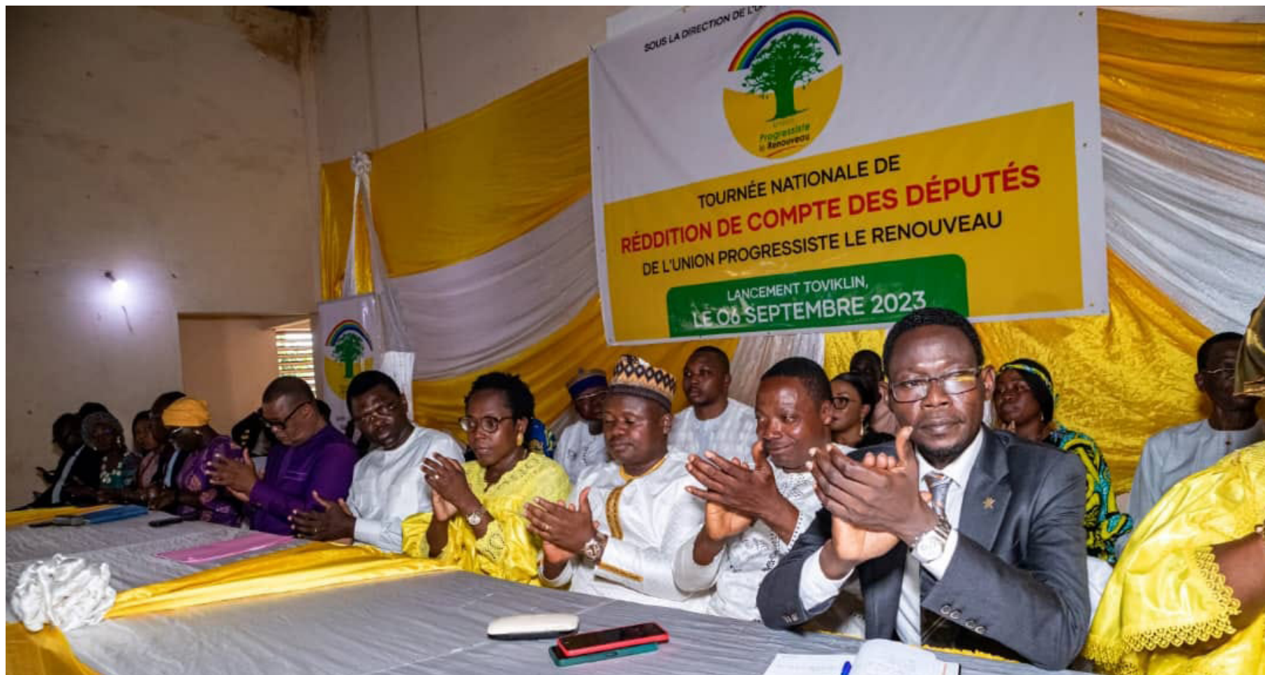
Cérémonie de lancement de la mission nationale de reddition de compte qui a permis aux députés de recueillir les préoccupations de leurs mandants dans tous les domaines : politiques, économiques, sociaux et culturels.