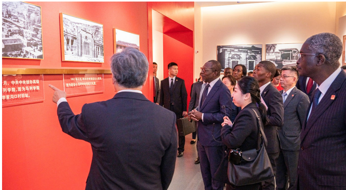
Au musée de l'école du PCC, le président Patrice Talon (au centre) "entend découvrir et apprendre, quitte à en tirer de la graine pour la vie politique de son pays".

Mais une chose devra retenir l'attention au cours de cette visite d'état: Patrice Talon au musée de la prestigieuse Ecole du Parti communiste chinois, le gigantesque PCC. Cette étape du séjour du président béninois est peut-être passée inaperçue ou sans intérêt pour beaucoup. Or, elle mérite d'être scrutée pour qui connaît et observe le chantre de la réforme du système partisan dans son pays.